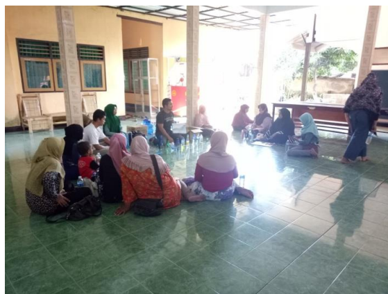
Gambar 2. Edukasi Air Hidrogen dan Sifat Asam Basa Air

pada karakter asam basa air yang terdapat disekitar lingkungan atau produk air yang dijual bebas, seperti gambar berikut.